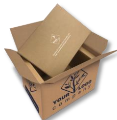
foodmailer® kann auch individuell bedruckt werden