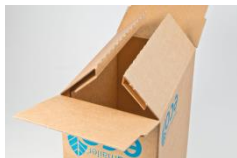
Spezielle, isolierende Bodenkonstruktion