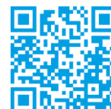
Eine Aufbauanleitung finden Sie hier im Video.