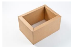
Patentierter, geklebter Isolationsring