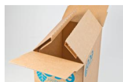
Spezielle, isolierende Bodenkonstruktion