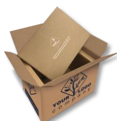
foodmailer® kann auch individuell bedruckt werden